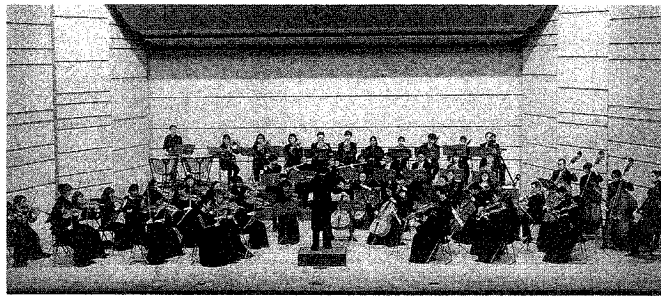
1995年12月5日 大阪厚生年金会館

定期演奏会は十二月五日 大阪厚生年金会館中ホール において下記のプログラム で行われた。